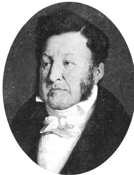
Links: Johannes Hotze (1734 – 1801), Arzt in Richterswil. Er gehörte zu Louis Philipps Bekanntenkreis in Bremgarten. Bild: Schweizerisches Nationalmuseum, LM-77207.