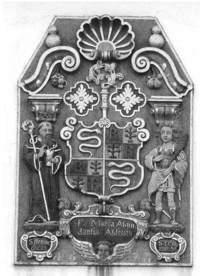
Aus dem Jahr 1673 stammt das Relief an der Ostfassade der einstigen Klosterscheune, auf dem der Heilige Donatus dem Heiligen Benedikt Gesellschaft leistet. Das Äbtissinnenwappen gehört der Äbtissin Maria Abundantia Reding von Biberegg (Amtszeit 1663 – 1687).

früheste Notter-Natter wahrscheinlich aus dem vierzehnten Jahrhundert, sicher aber vor 1425.