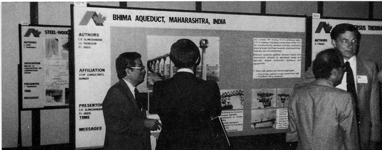
Poster Session: authors of a poster in discussion with other Congress participants