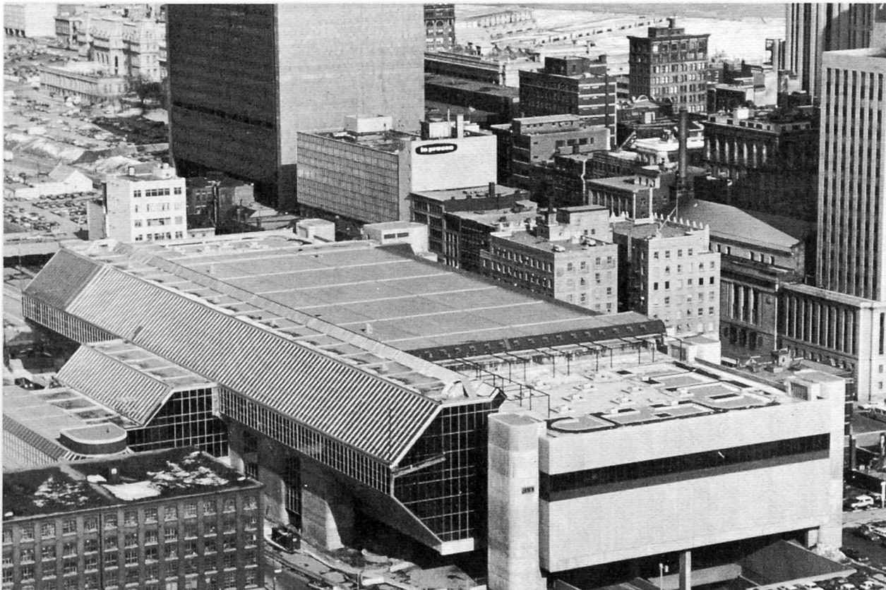
Fig. 2 Le Palais des Congrès de Montréal