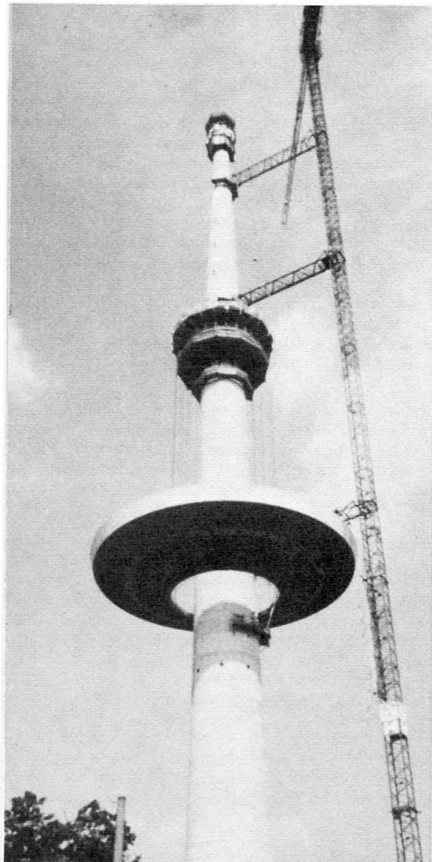
Bild 2 Hochziehen der 1200 Tonnen schweren Kegelschale