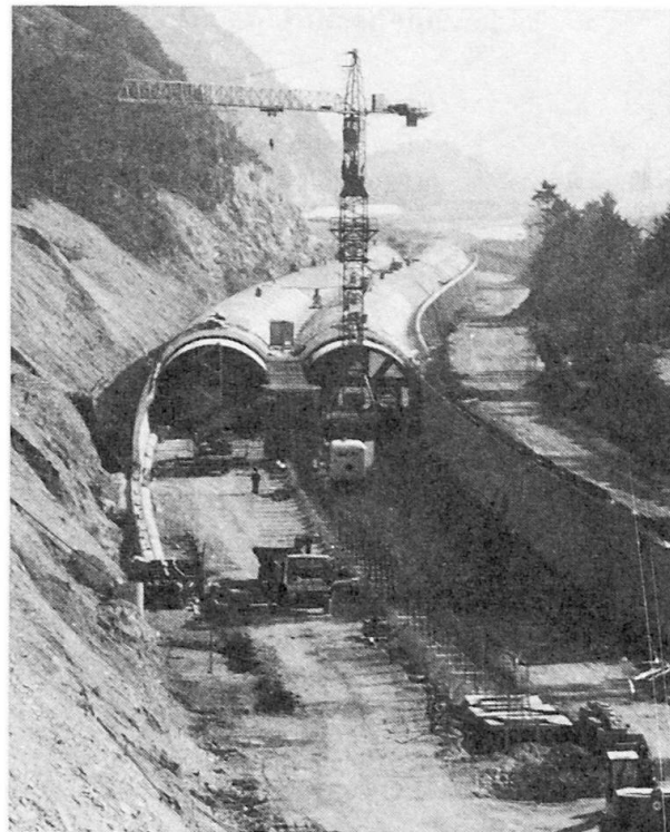
(L. Autengruber) Bild 2 offene Galerie bzw. Tunnel