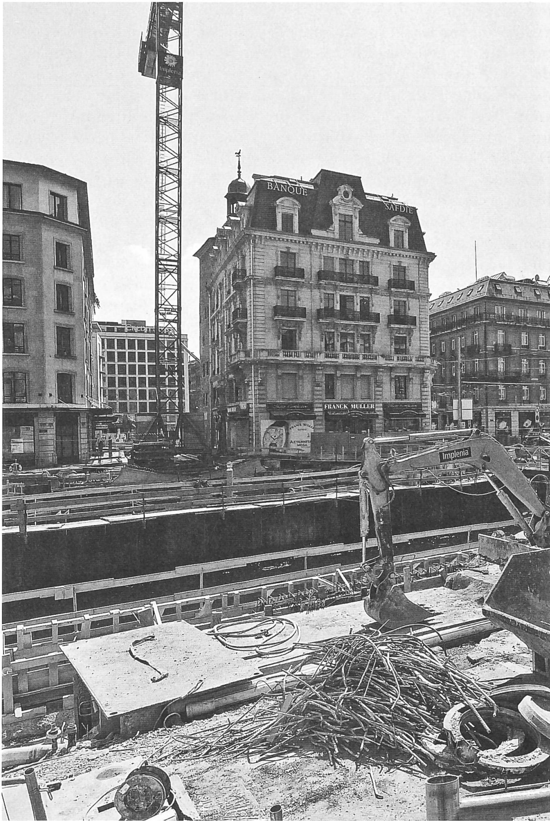
Le pont de l'Île au XXI e siècle – Construction des piles et du tablier, avril 2011