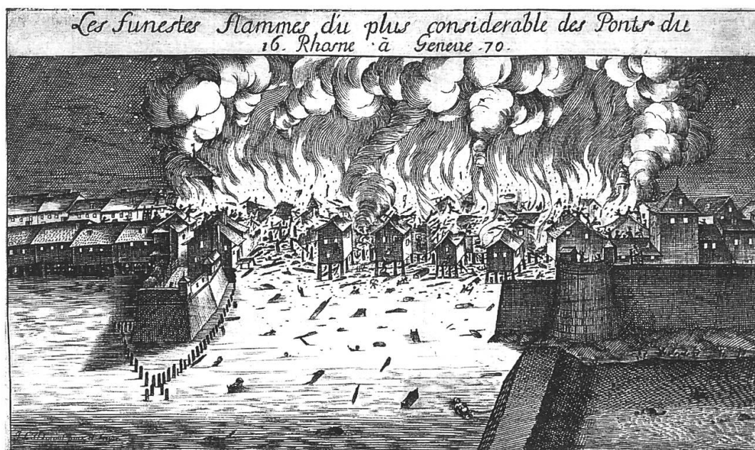
L'incendie du pont, vue tirée de Abraham Bonnet, «Poème sur l'embrasement arrivé à Genève sur le pont du Rhodne, dès la nuit du lundy 17 jusques au jour du mardy 18 janvier 1670», Genève, 1671?

là d'opérer une véritable stratégie de survie devant les forces de la nature, pour l'intégrer, l'assimiler et la maîtriser » 12 .