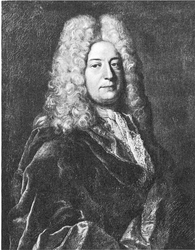
Fig. 4 Gardelle, Robert, Portrait d'Antoine Tronchin , non localisé, publié dans J. CROSNIER, «Bessinge», pl.