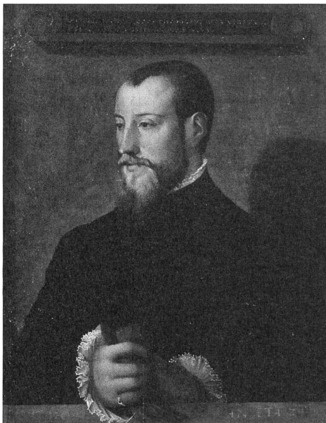
Fig. 2 Anonyme, Portrait de Théodore de Bèze jeune à l'âge de 24 ans , milieu du XVI e siècle, 45 × 32 cm, Bibliothèque de Genève (collection du Musée historique de la Réformation, inv. mhr t 32).

Le fils de Théodore Tronchin, Louis I Tronchin (1629-1705), pasteur et professeur de théologie à l'Académie de Genève, incarne, avec quelques-uns de ses contemporains tel que Jean-Robert Chouet (1642-1731), un renouveau du protestantisme de la République lémanique du fait du rapprochement du cartésianisme qu'ils ont opéré. C'est probablement à l'initiative de l'un de ses élèves, le théologien Jean-Alphonse Turretini (1671-1737), que Jean Dassier (1676-1763) réalisa en 1725 la série des médailles intitulées les Réformateurs de l'Eglise , illustrant des théologiens de plusieurs pays 20 . Louis I