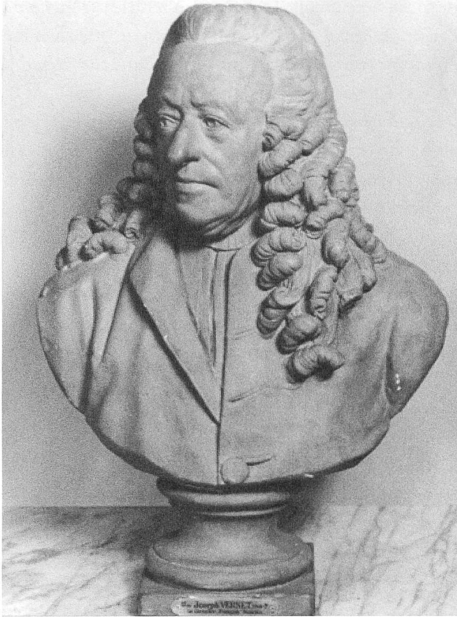
Fig. 5 Joseph Vernet, Buste de François Tronchin , vers 1780, plâtre, 69 cm avec le socle, Genève, Musées d'art et d'histoire, inv. 1911-50.

étaient inscrits quelques vers rédigés par Stanislas-Jean Boufflers :