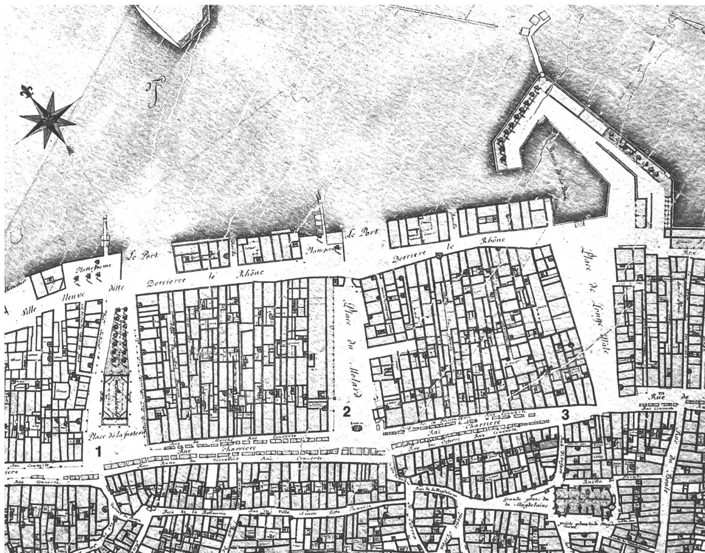
Fig. 3 Les billets trouvés dans les «Rues Basses» (Plan Billon, 1726).