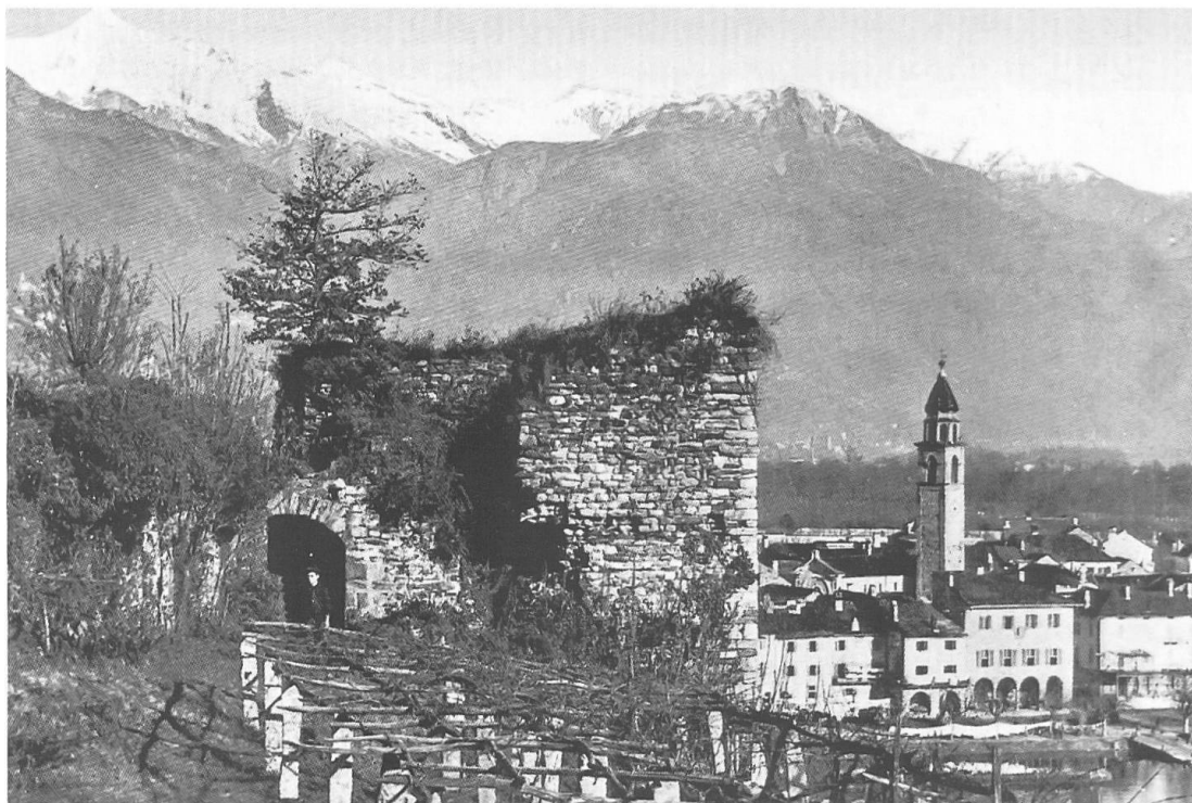
Torre sud-est del castello di S. Michele. Fotografia di S. Pisoni, Ascona 1909