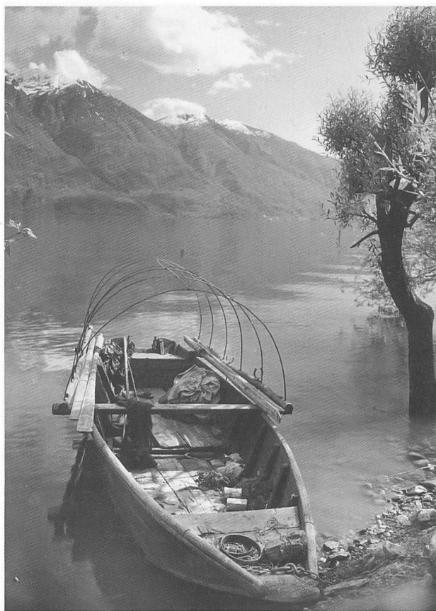
Barca ad arcioni con l'equipaggiamento per la pesca

Il malcontento divenne generale: furono tenute varie riunioni e si decise di reclamare a Berna, presso il Dipartimento federale, affinché le autorità intervenissero a difendere i diritti dei pescatori ticinesi. Lo stesso Dipartimento, preso atto della questione, mandò a Sesto Calende una commissione, di cui fecero parte anche due pescatori muraltesi 22 , per verificare se la causa della scomparsa del pesce non fosse da attribuire ai lavori di sbarramento e alla mancanza di una «scala di monta» per i pesci. Con belle parole ai convenuti fu dato ad intendere che le regole erano state rispettate, ma i nostri inviati dovettero constatare che non era così, la «scala» era stata modificata in modo tale da renderla inutile.