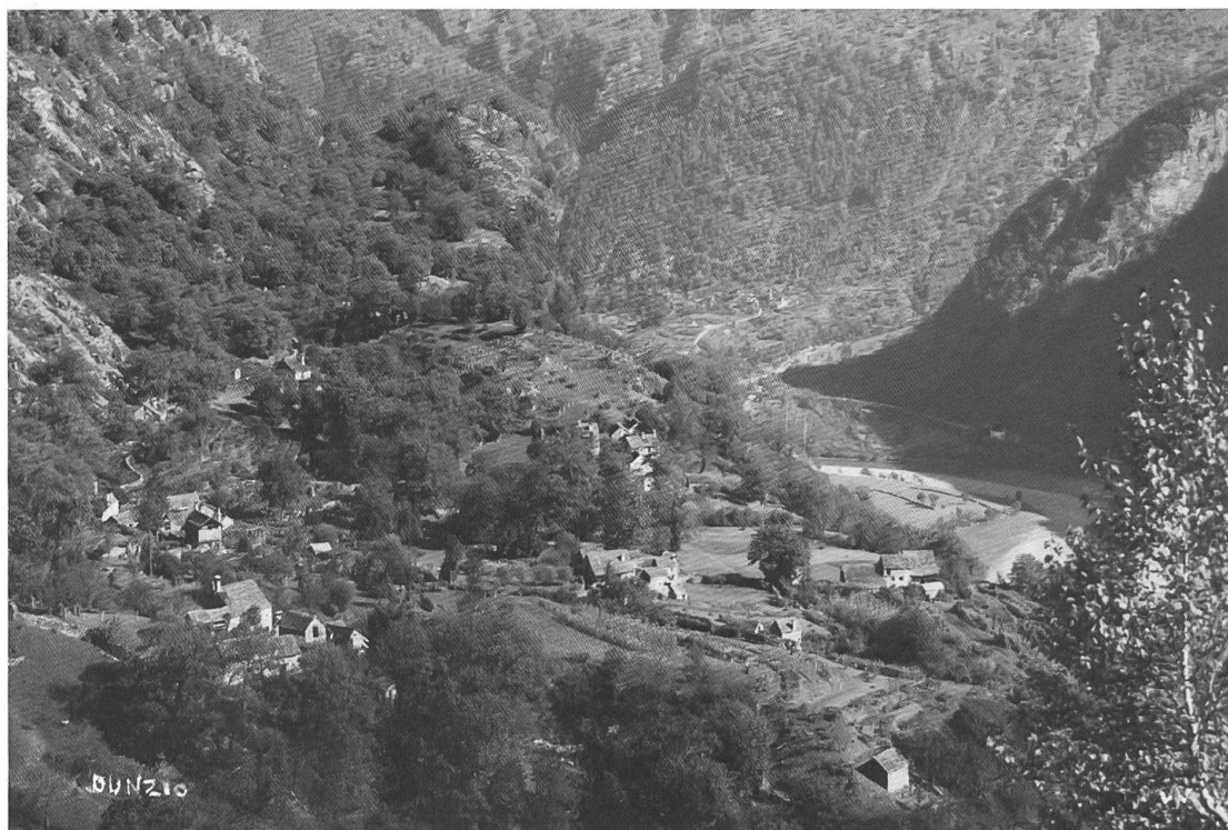
Veduta di Dunzio, adagiato sul terrazzo glaciale: nel 1946 la superficie a coltivi è ancora assai estesa.