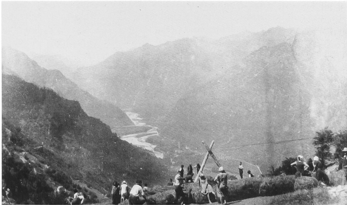
Anni 1929/30: il fieno falciato sui monti di Capoli, avvolto in reti, viene mandato a valle – verso la Valmaggia! – col filo a sbalzo (M. DE ROSSA, Motivo di una secolare controversia. Dunzio di Tegna,... ).