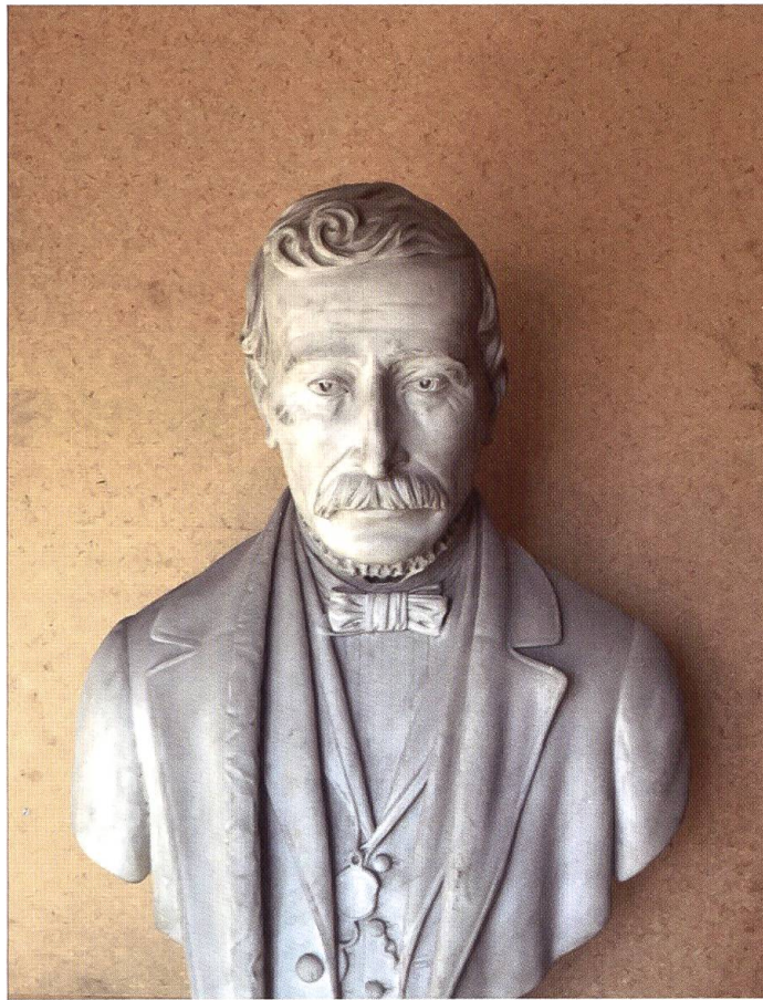
Busto di Francesco Balli.

Le ampie vedute del sindaco Balli e la sua energia nel portare a compimento i suoi propositi furono anche facilitati dai tempi in cui ebbe ad operare: gli ultimi anni dell'Ottocento e il primo decennio del Novecento (quest'ultimo caratterizzato in tutta Europa da quella che fu chiamata la Belle Époque, che si qualifica per il mito del progresso e per un fervore realizzativo che accumulava le opere dell'autorità, a qualsiasi livello, con quelle dell'iniziativa privata), furono particolarmente propizi.