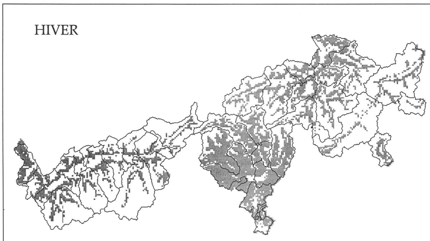
Figure 2 : Distribution des carrés kilométriques remplissant les conditions en hiver (période avec neige).

La distribution potentielle du loup à cette saison correspond assez bien aux carrés kilométriques comprenant moins de 16% de zones agricoles (englobe également les zones forestières). Le canton du Tessin, qui comprend une surface boisée importante (48%) et une altitude moyenne plus basse,