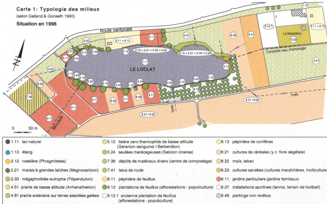
Carte 1: Typologie des milieux (selon Galland & Gonseth 1990) Situation en 1996