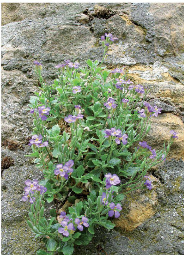
Figure 3 : Aubrieta deltoïdea (L.) DC. (Brassicacée).