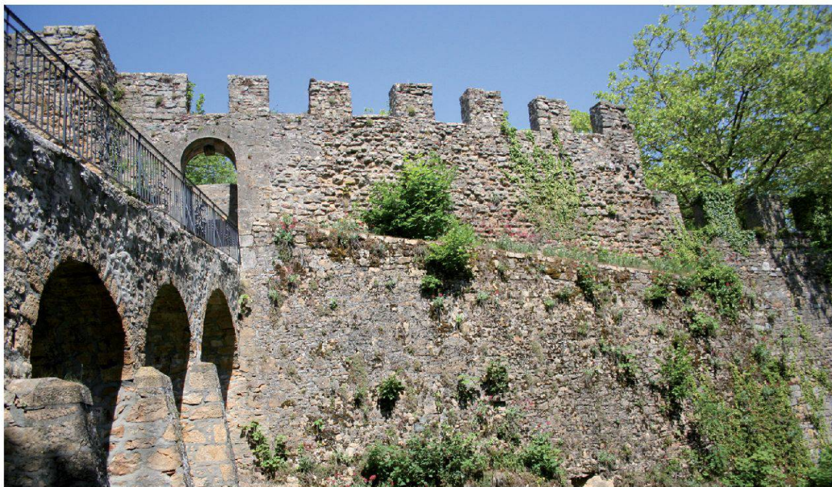
Figure 1 : Mur d'enceinte de l'esplanade du château de Neuchâtel. La partie étudiée est le grand rectangle mural au centre de l'image.