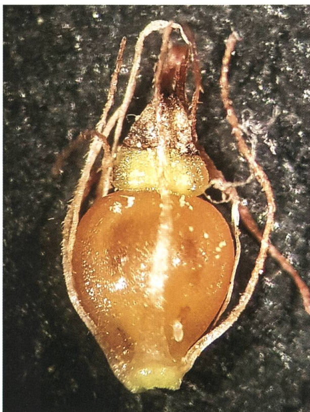
Figure 4. Eleocharis mamillata, akène et soies du périgone.