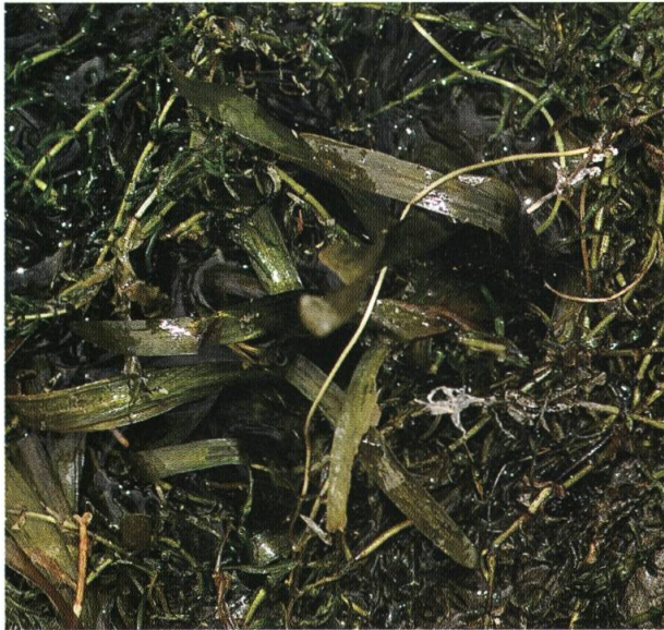
Figure 8. Vallisneria spiralis, feuilles.