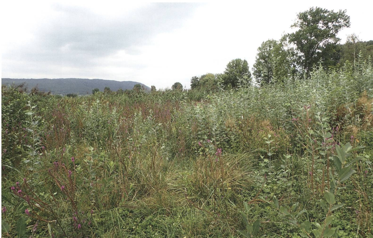
Figure 14. Développement massif des ligneux.