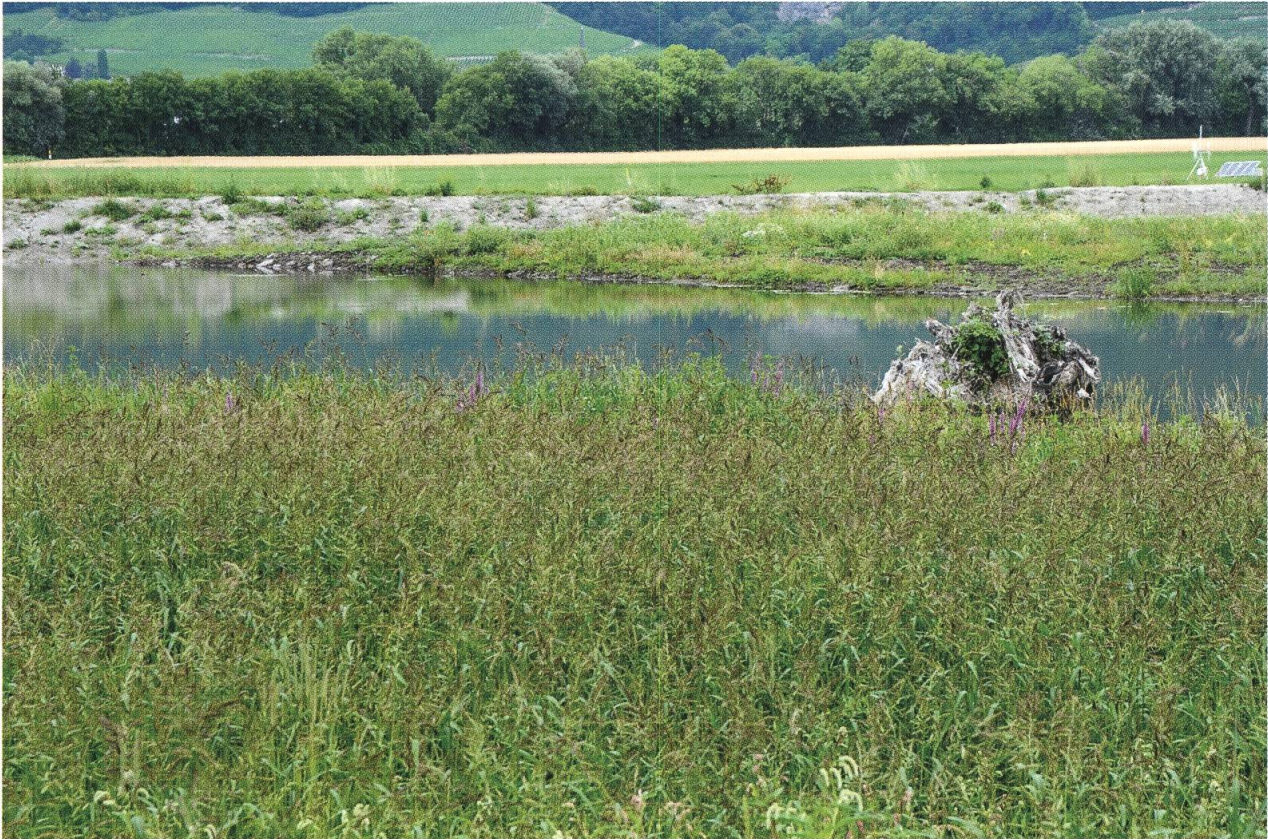
Figure 10. Développement massif d' Echinochloa crus-galli en 2016.