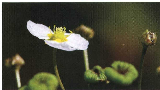
Figure 2. Alisma lanceolatum, habitus.

deux exemplaires pour les mêmes raisons que pour l'espèce précédente. Une partie des plantes présentait des fleurs anormales avec des pétales surnuméraires.