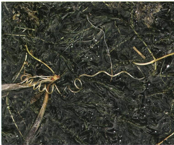
Figure 9. Vallisneria spiralis, pédicelle spiralé et fleur femelle. 19.09.2016.