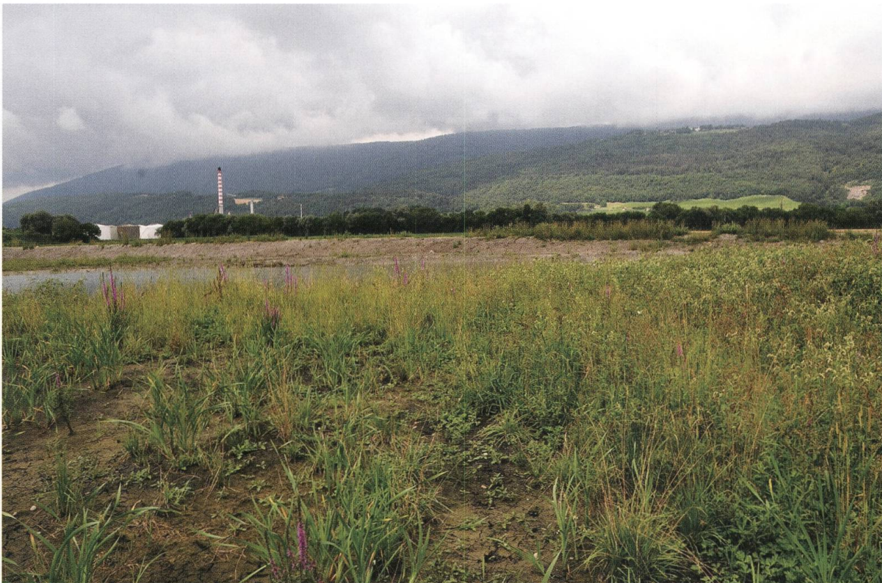
Figure 12. Végétation pionnière.