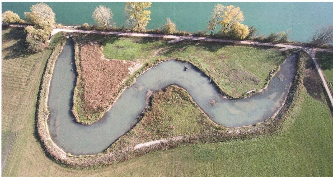
Figure 15. Photo : Vue aérienne du chenal deux ans après les travaux. © Aquarius, automne 2017.

contre Elodea nuttallii qui se développe dans le chenal en association avec de nombreuses autres plantes aquatiques.