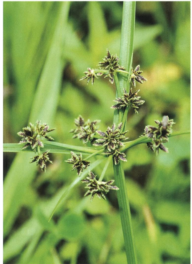
Figure 3. Cyperus fuscus, inflorescence.