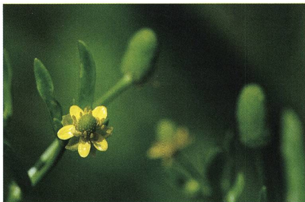
Figure 5. Ranunculus sceleratus, fleur avec fruits en arrière-plan.