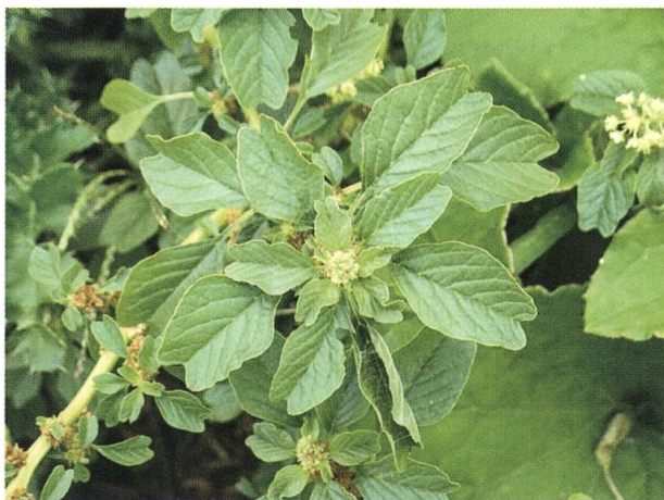
Figure 7. Amaranthus emarginatus, inflorescence.

Ce néophyte n'a été distingué que récemment dans les flores suisses d' Amaranthus blitum , qui est quant à lui un taxon indigène. Il s'en distingue par ses feuilles vertes dépourvues de taches et profondément échancrées (fig. 7), ainsi qu'à la taille de ses fruits inférieure à 2 mm. Deux foyers ont été observés dès 2016, sur la digue et à l'intérieur du périmètre d'étude. A. emarginatus semble bien répandu sur le Plateau suisse (INFO FLORA, 2018) et il se pourrait qu'il y soit sous-échantillonné. D'autres floristes ne mentionnent qu' A. blitum dans la région (DRUART, 2017).