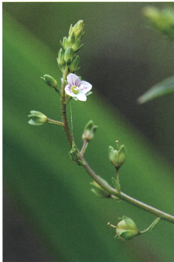
Figure 6. Inflorescence de Veronica catenata.