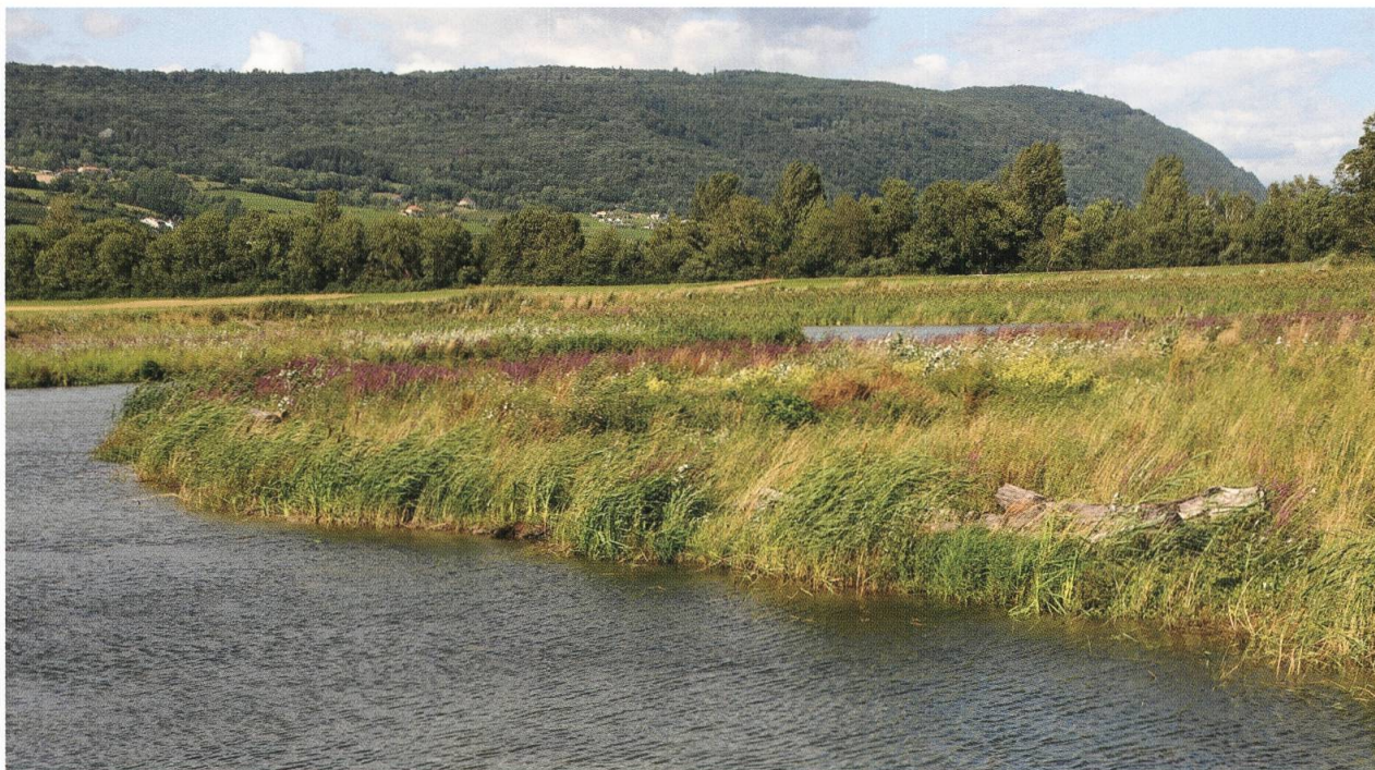
Figure 13. Développement important de la végétation.