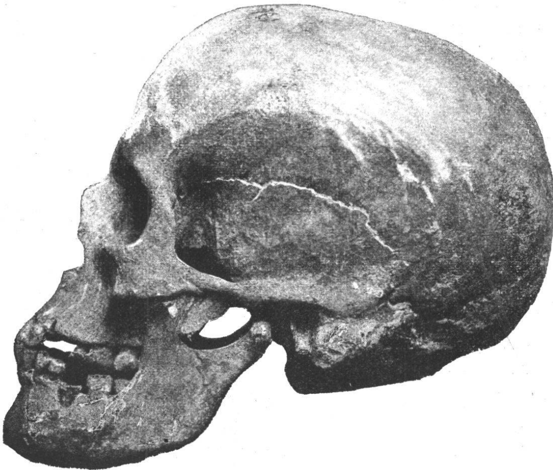
Fig. 29. — Crâne masculin n° 12. Norma lateralis .

prognathisme d'après la méthode de Flower atteint le chiffre considérable de 104,08.