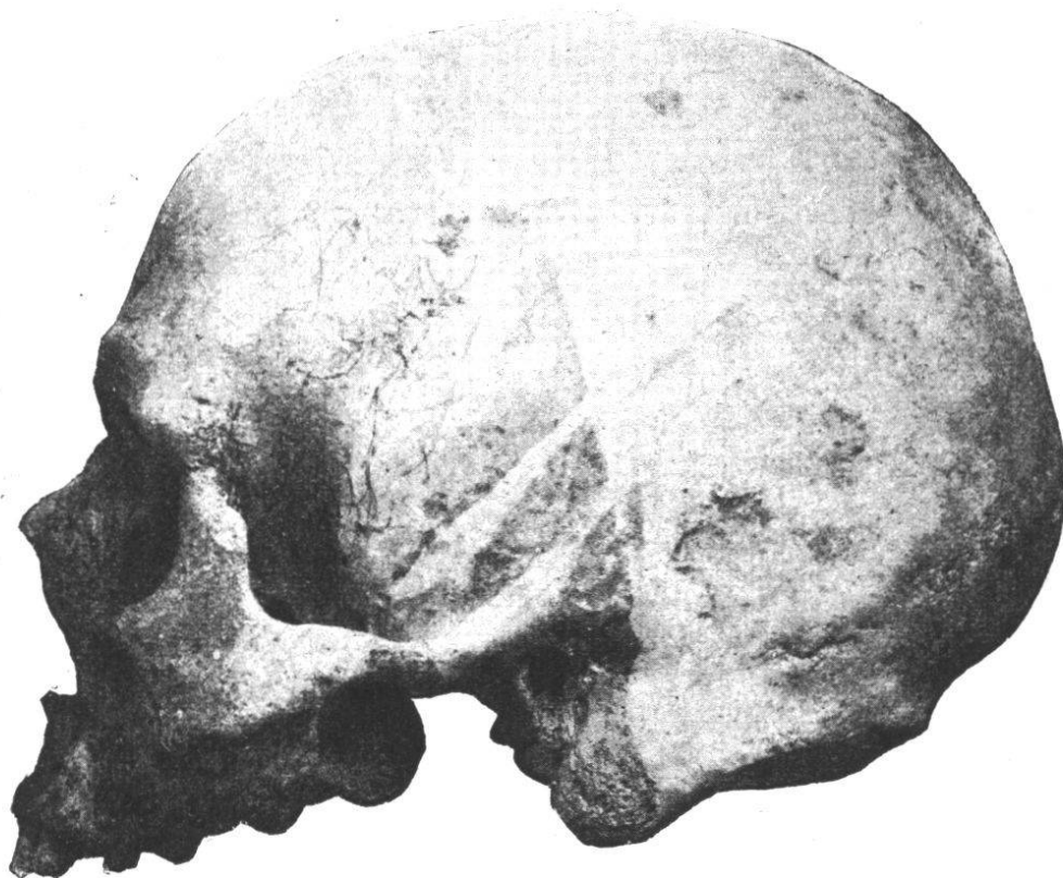
Fig. 36. — Crâne masculin n° 26. Norma lateralis .

La courbe sagittale et occipitale ne forme pas de saillie très appréciable de la région postérieure du crâne. Les lignes courbes occipitales supérieure et inférieure sont extraordinairement puissantes ; les apophyses mastoïdes sont volumineuses. Il y a un prognathisme assez marqué de la région sous-nasale (indice de 100.97). Le ptérion est en H.