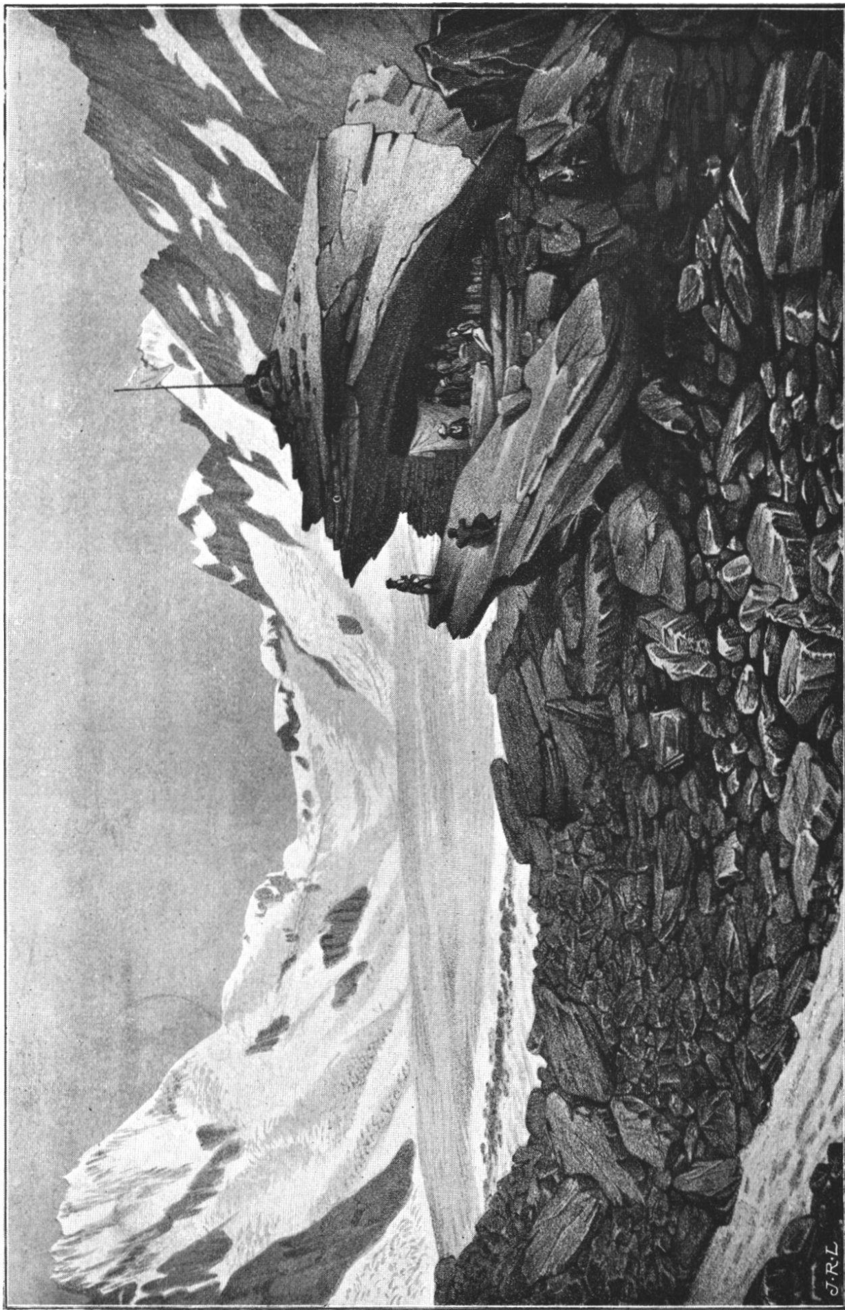
Hôtel des Neuchâtelois sur la Mer de glace du Lauter-Aar et Finster-Aar.

(Reproduction au 3/5 du dessin contenu dans „Untersuchungen ueber die Gletscher v. Louis Agassiz, 1840.“)