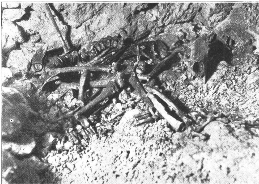
FIG. 3. — Squelette du grand ours, en place.