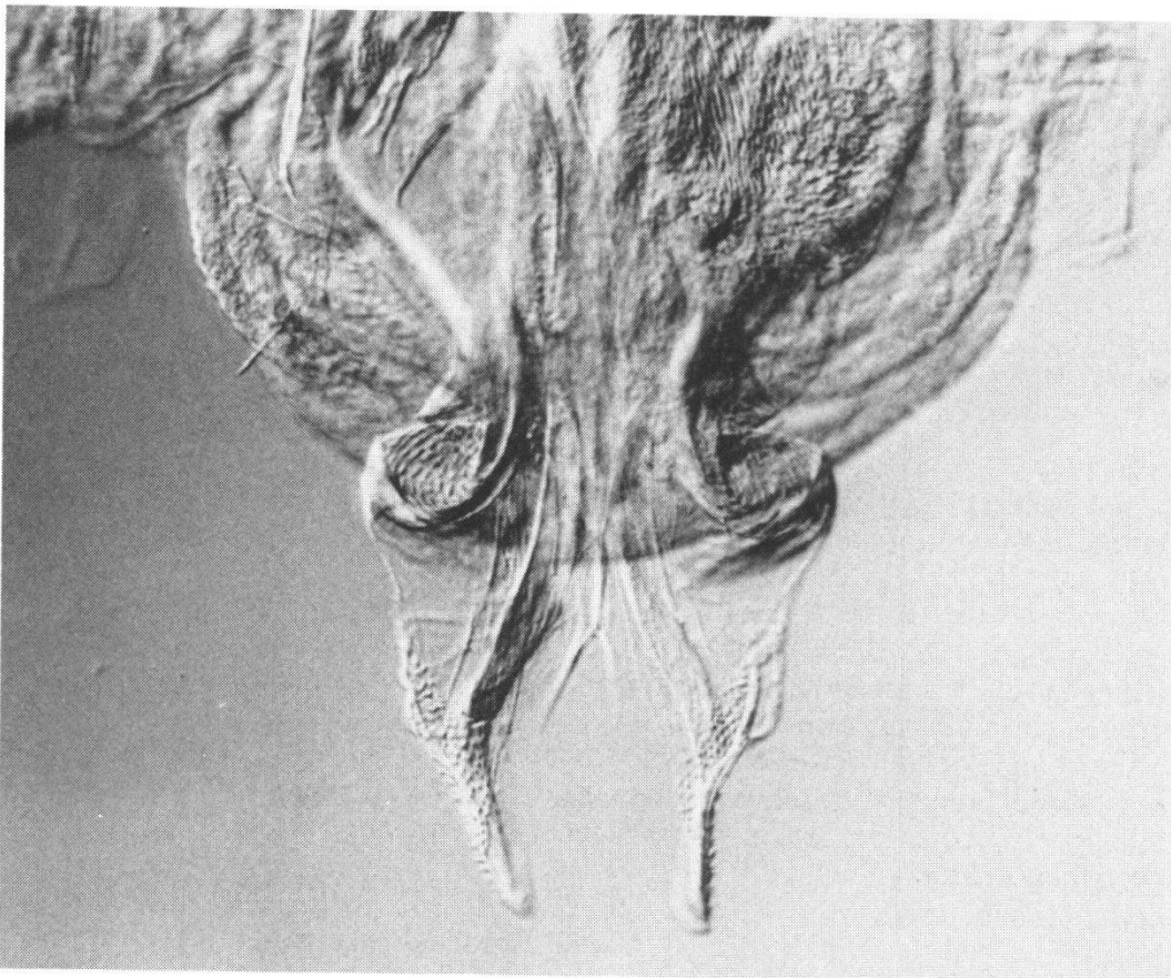
Figure 3.— Chloroperla nevada Zwick, 1967 : genitalia de l'holotype. Grossissement 160 x.