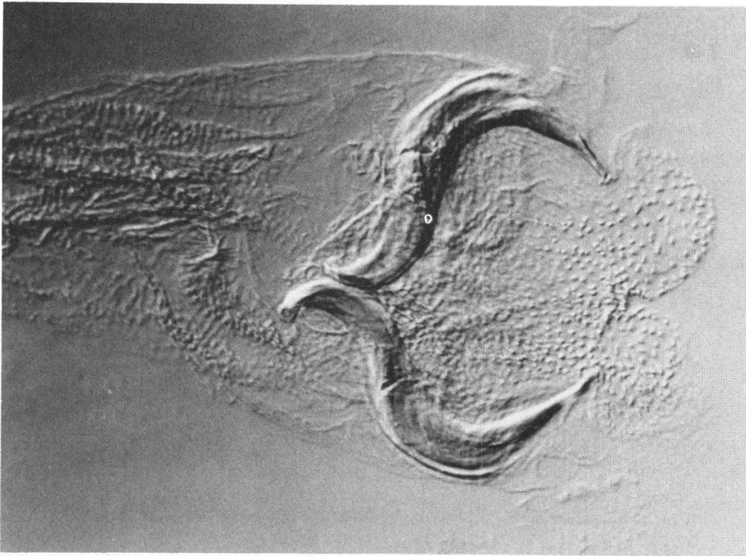
Figure 2.- Plesioperla assamensis Zwick, 1967: pénis de l'holotype. Grossissement 160x