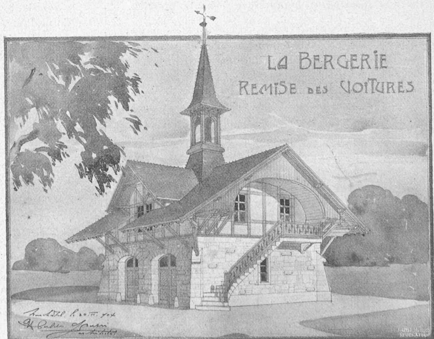
Fig. 1. — Villa « La Bergerie », près Nyon. — Remise des voitures. Architecte : M. Ubaldo Grassi, à Neuchâtel.

Cependant, si l'on a mal bâti, et si parfois l'on bâtit mal encore, il serait injuste d'en accuser et d'en rendre responsables les architectes seuls. Car en général l'architecte ne construit pas pour lui, mais pour un client qui n'a souvent pas assez de goût et de sens esthétique pour juger le caractère d'une construction et pour préavisier d'une