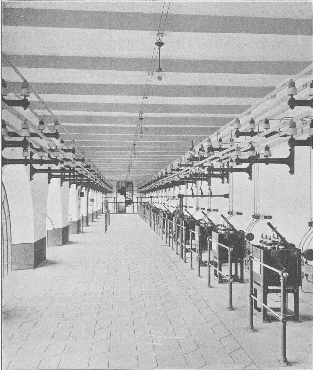
Fig. 23. — Salle des connexions.

Fournisseurs. — Les turbines ont été fournies par la maison Piccard, Pictet & Cie, à Genève. Les alternateurs,