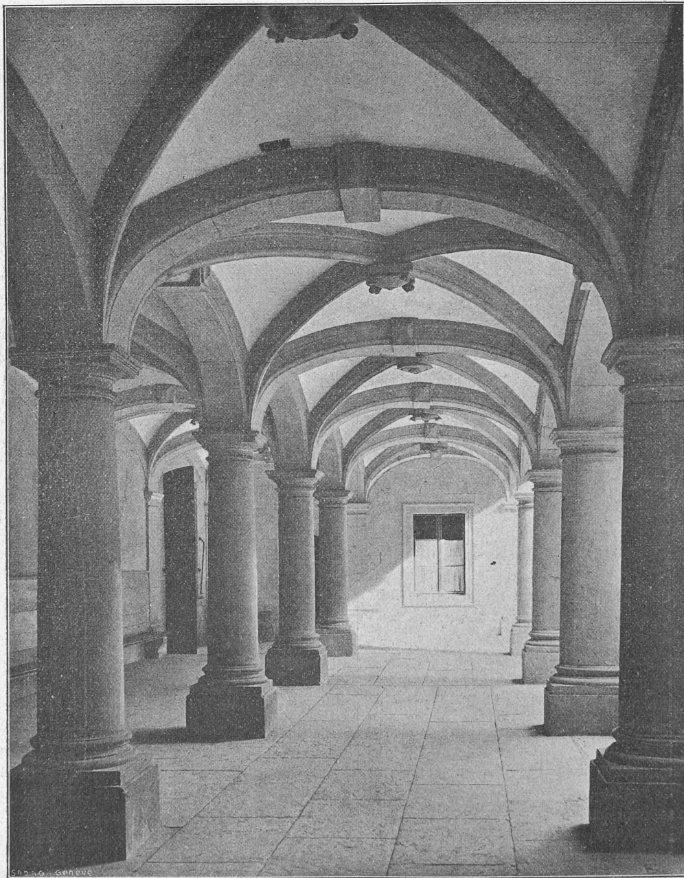
Cliché de « La Maison de Ville de Genève ». — A. Jullien, éditeur.

La rampe fait le tour d'un noyau de plan carré, très