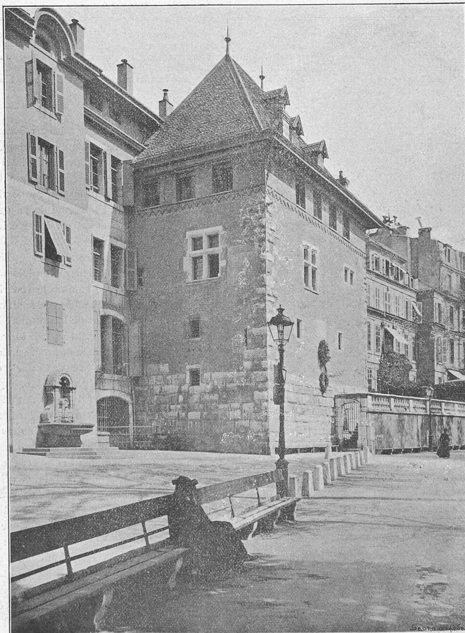
Cliché de « La Maison de Ville de Genève ». — A. Jullien, éditeur.

sculpturale. Les motifs, des plus variés, prouvent avec quel soin du détail cette belle pièce de menuiserie fut exécutée. Entre les poutrelles, des couvre-joints divisent les entretoises en un certain nombre de caissons. Les gorges et les tores des moulures du plafond ont des profils d'une