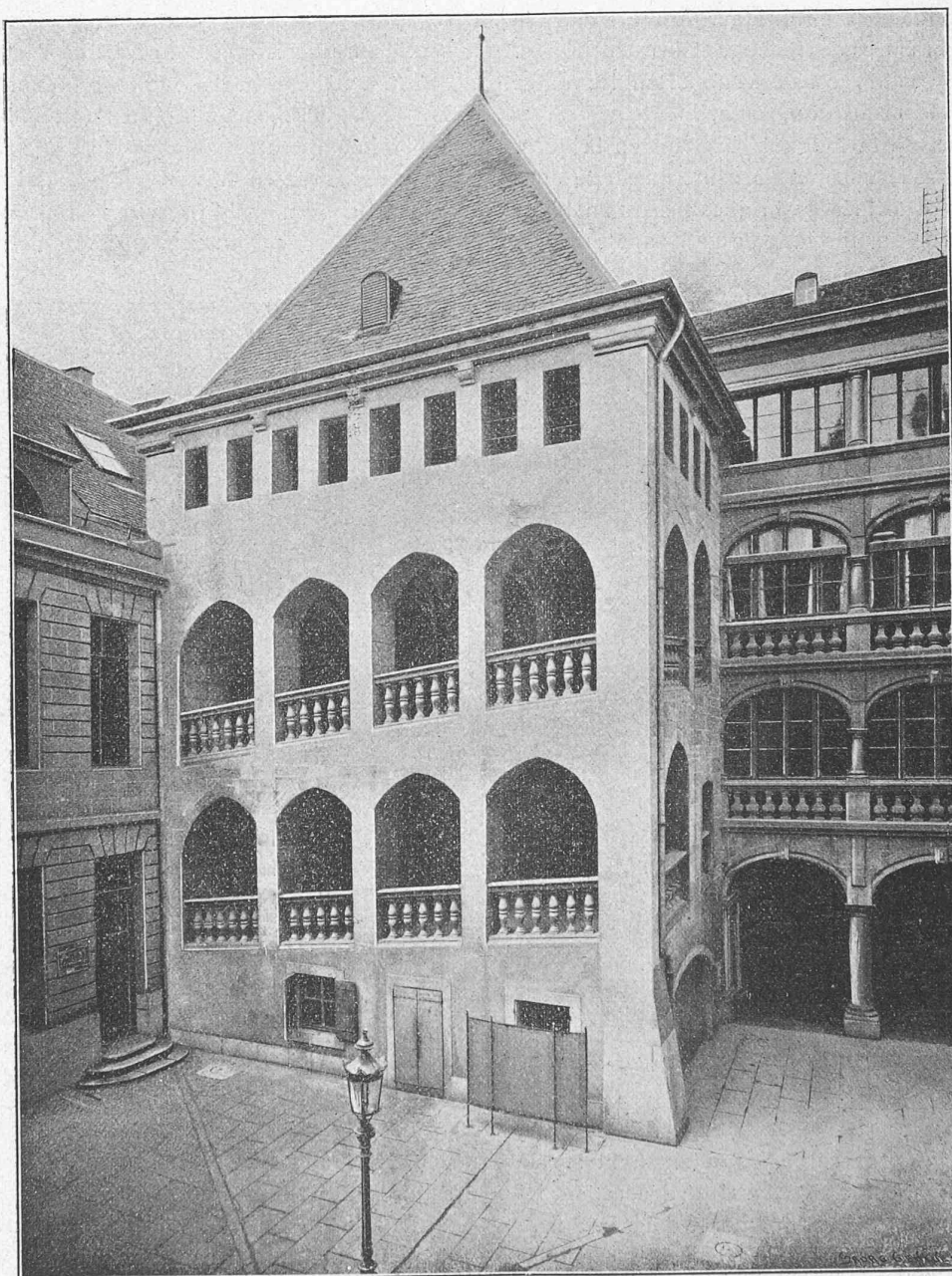
Cliché de « La Maison de Ville de Genève ». — A. Jullien, éditeur.

fonds, donne bien plus l'impression d'une tour de château-fort que d'une tour de fortification. Un simple coup d'œil jeté sur cet édifice confirme les données fournies par les documents; l'examen détaillé auquel M. Martin soumet la construction confirme cette supposition.