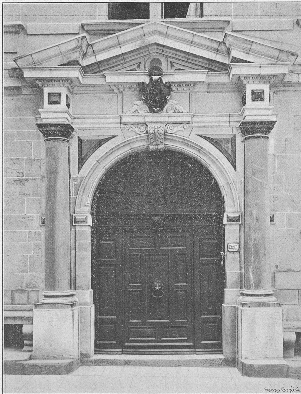
Cliché de « La Maison de Ville de Genève ». — A. Jullien, éditeur.

les différentes maisons constituant alors l'édifice communal. Chacune de ses faces présentait deux rangs superposés de larges arcades, quatre à chaque étage, suivant la pente de la rampe. A l'étage supérieur huit petites ouvertures éclairaient de chaque côté l'intérieur. Aucune mou-