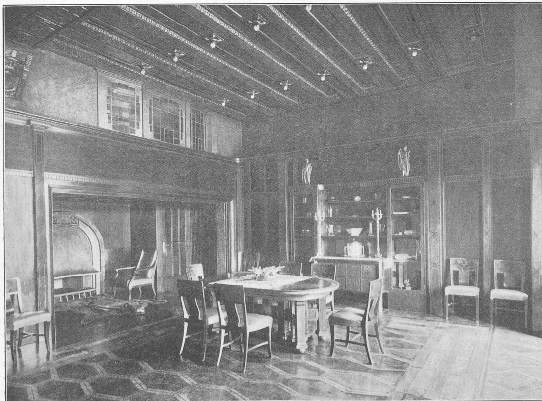
Maison de M. Bruno Schmitz, à Charlottenbourg. — Salle à manger. — Architecte : Dr-ing. Bruno Schmitz.