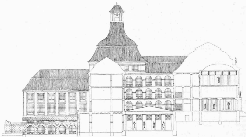
Clichés de la « Schweizerische Bauzeitung ».