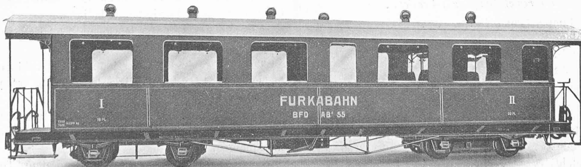
Fig. 20. — Voiture de I re et II e classe, à 4 essieux.

Société industrielle suisse, à Neuhausen.