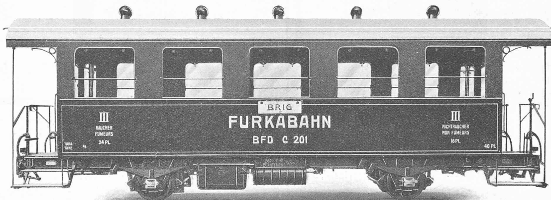
Fig. 19. — Voiture de III me classe, à 2 essieux.

Fourgons à bagages avec compartiment postal à 4 essieux, série FZ 4 .