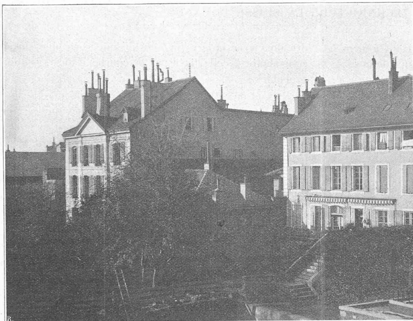
Fig. 1. — Face sud des bâtiments de Liège. Anciens immeubles situés sur le terrain de la Société immobilière de la rue du Lion d'Or.