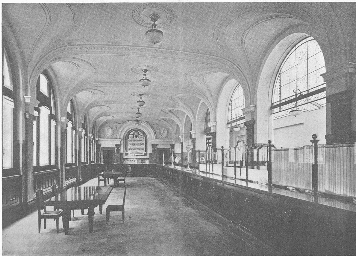
Fig. 3. — Nouveaux immeubles de la rue du Lion d'Or. Salle des guichets de la Société suisse de banque et de dépôts.

trement; ces dimensions ressortent essentiellement de conceptions architecturales et nous ne voulons pas nous en occuper pour le moment. C'est plutôt la qualité des murs qui doit nous intéresser d'abord, car son influence est remarquable aussi; et alors, vis-à-vis de la grande diversité que l'on rencontre dans la fabrication des murs, nous pouvons prétendre que, pour aussi longtemps que l'on n'arrivera pas à assurer pour chaque genre de mur une qualité relativement uniforme, le problème des encastresments devra être considéré comme étant irrésolu, c'est-à-dire indéterminé. C'est pour cette raison que, pour l'instant du moins, nous devons condamner tout particulièrement la tendance de certains constructeurs de calculer leurs planchers sur la base d'un seul et unique état d'en-