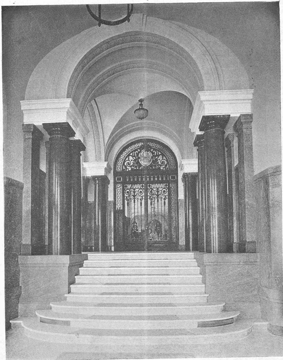
Fig. 4. — Nouveaux immeubles de la rue du Lion d'Or. Salle des dépêches de la Société suisse de banque et de dépôts .

la responsabilité qui lui incombe pour la qualité des murs, qu'il conçoit, d'une manière presque générale, indépendamment des vœux éventuels de l'ingénieur. Nous créerons ainsi simultanément et les conditions nécessaires à une évaluation plus sûre et par suite plus économique des encastresments effectifs et une garantie importante pour la bonne durée de l'état de travail admis qui fait la base des calculs justificatifs. Pareille collaboration permettra non seulement d'engager MM. les architectes à un contact plus intime et rémunérateur avec les ingénieurs qui leur font du béton armé, mais aussi et surtout de les intéresser plus sérieusement aux grandes difficultés qu'il y a souvent à résoudre à la fois économiquement et avec le degré de sécurité nécessaire les problèmes qu'ils présentent à leurs ingénieurs responsables des travaux en béton armé.