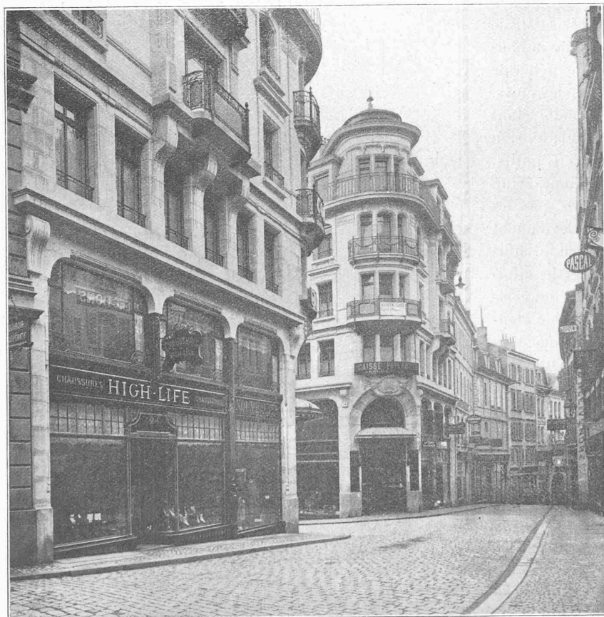
Fig. 2. — Débouché de la rue du Lion d'Or dans la rue de Bourg (voir fig. 8). Nouveaux immeubles de la rue du Lion d'Or.

Après intégration et en substituant dans l'expression \delta_m' + \delta_m'' = \delta_m la valeur trouvée pour M_S (formule IV) on arrive finalement à la relation importante qui permet de calculer le module E_f cherché en fonction des angles et de l'inflexion trouvés :