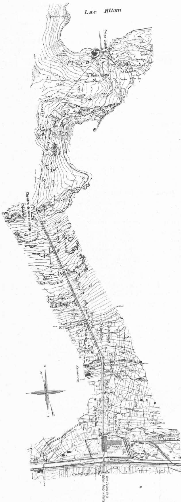
Fig. 8. — Centrale de Ritom. — Plan de situation. Echelle 1: 10 000.