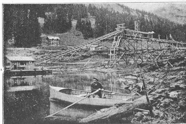
Fig. 40. — L'installation de pompage et l'estacade devant l'émissaire naturel du lac, le 20 novembre 1920, la première tranche d'eau de 9 m. 60 de profondeur étant évacuée.

Le 27 décembre, le puits atteignait la tête de la galerie g_1 . A minuit, lorsqu'on en sortit, une inspection minutieuse fut faite de l'armature de ce puits et de la surface du terrain à son sommet. Rien ne trahissait même le moindre symptôme d'écroulement de la berge. Le lendemain matin on constata qu'un glissement de terrain avait enlevé la tête du puits et entraîné au lac treuil et moteur. Quelques minutes furent consacrées à l'examen des lieux et de la situation, puis après constatation qu'il ne s'agissait que d'un glissement de surface intéressant surtout la couche de boue, ordre fut donné de reprendre le travail au même point. Le treuil et le moteur purent être repêchés non sans peine et le déblayement commença.