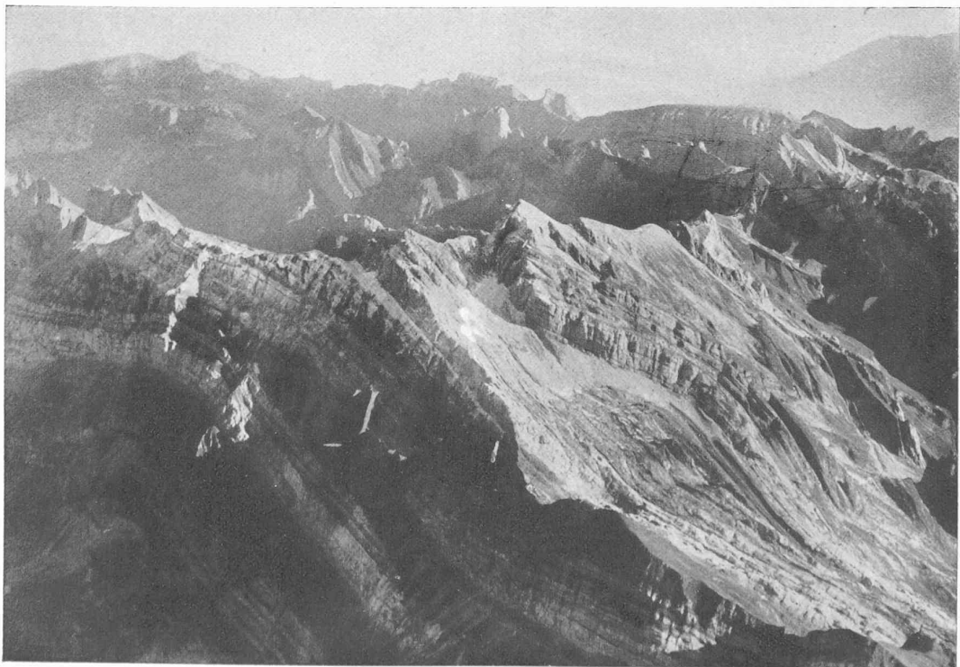
Sântis. Vue, prise de l'ouest, du plissement des couches. A droite, l'Altmann ; à gauche, dans le lointain, le Kasten.