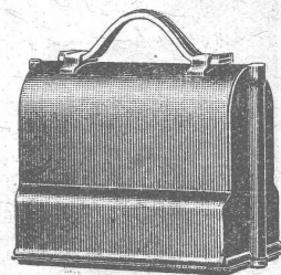
Niveau emballé, 1/6 grandeur naturelle

S. A. de Vente H. Wild - Heerbrugg Téléphone 95 (St-Gall)