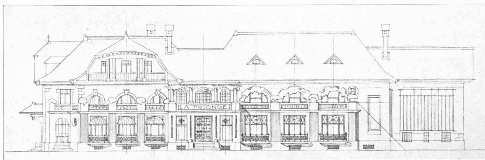
Façade sud. — 1 : 400.