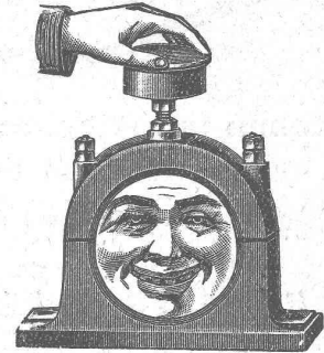
Palier refroidi pendant la marche au moyen de graisse ou de l'huile réfrigérante Brun.