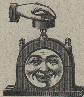
Palier refroidi pendant la marche au moyen de graisse ou de l'huile réfrigérante Brun.