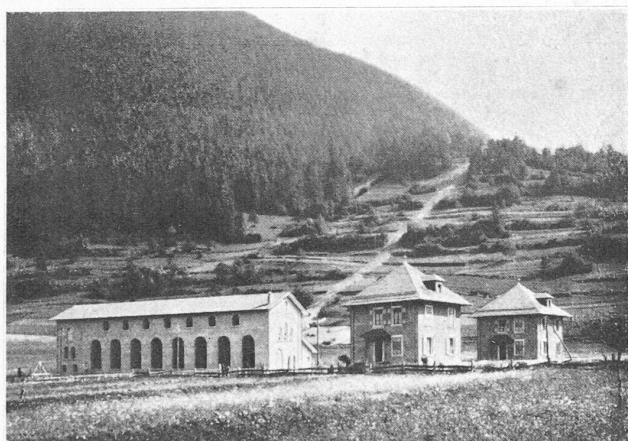
Fig. 1. — Usine de Sembrancher avec les maisonnettes du chef et du sous-chef d'usine. A droite le tracé de la conduite forcée.

Introduction. — L'usine de Sembrancher, dont nous nous proposons d'étudier les installations électriques 1 , est située à environ 1 km à l'est du village du même nom. On y accède par une assez bonne route se détachant de