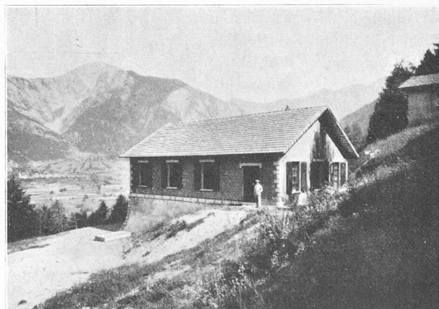
Fig. 4. — Chambre de mise en charge.

celle du Grand Saint-Bernard à la sortie du village. Un vieux pont de bois, trop faible pour supporter le poids des pièces de machines, dut être remplacé par un pont métallique.