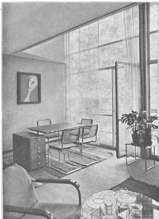
Studio dans la maison de verre, de Le Corbusier , à Genève.

Dès que nous pénétrâmes dans le second bâtiment, au