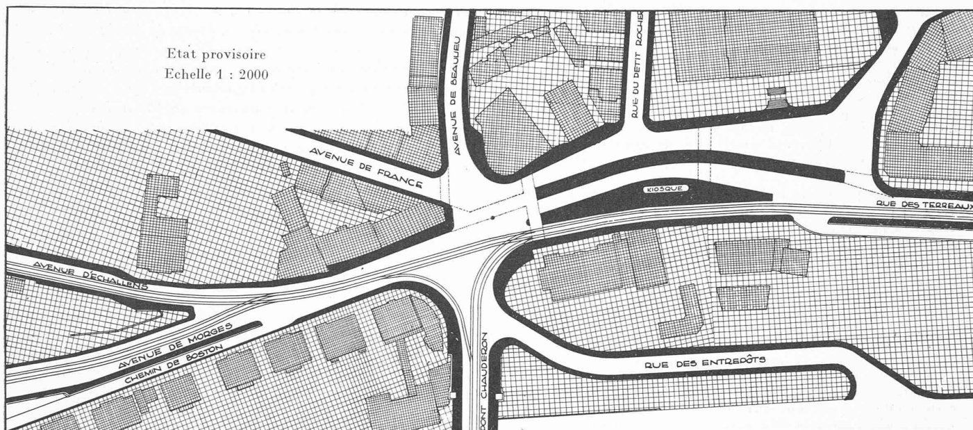
Fig. 1. — Aménagement de la place de Chauderon, à Lausanne.

d'un nouveau trottoir et des raccords de chaussée nécessaires qu'implique le redressement du mur de soutènement du Crédit Foncier, ainsi que des travaux sur l'emplacement de l'édicule démoli, il devient indispensable de réaliser, partiellement tout au moins, l'aménagement général de la place.