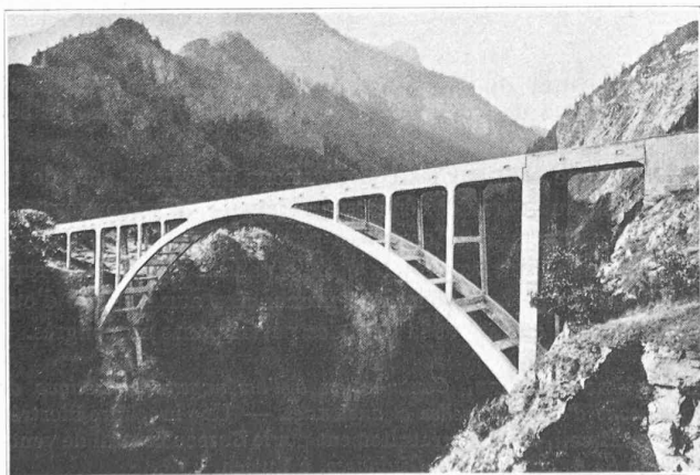
Fig. 2. — Le pont de Gueuroz.