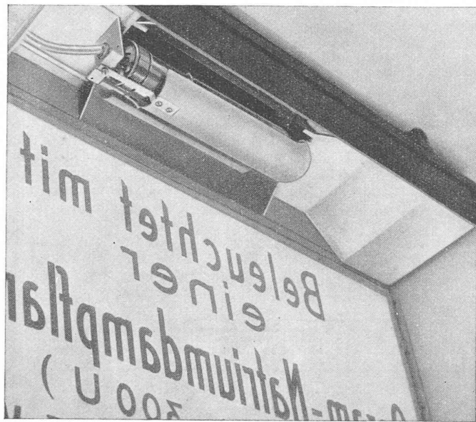
Fig. 1. — Vue de l'intérieur d'un transparent à double face éclairante.

L'illumination des transparents au moyen de lampes à incandescence, en éclairage direct — tel qu'il est usuellement pratiqué — est entachée du défaut que, pour réaliser une uniformité convenable de l'éclairage, il faut, ou bien faire usage d'une caisse assez profonde, ce qui n'est pas toujours possible, pour des raisons d'ordre constructif, ou bien équiper le transparent avec un grand nombre de lampes à incandescence, ce qui ne laisse pas de causer des dépenses de service élevées. En revanche, en éclairage indirect , il est possible de réduire la profondeur de la caisse, tout en n'usant que d'un nombre relativement faible de lampes ; mais il ne faut pas