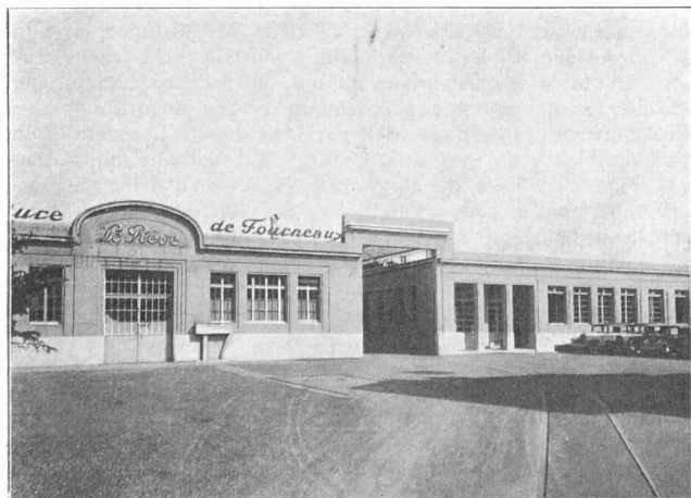
Cour d'entrée et partie de la façade principale de l'usine « Le Rêve » S. A. avec voie industrielle.

Jour et nuit le travail de brûlage se poursuit, pour des raisons d'ordre technique, d'une part, et pour satisfaire aux besoins de la fabrication d'autre part. L'émaillage « Le Rêve » ainsi obtenu est d'une solidité à toute épreuve, grâce à la haute qualité des matières premières le constituant et le soin méticuleux apporté dans son application.