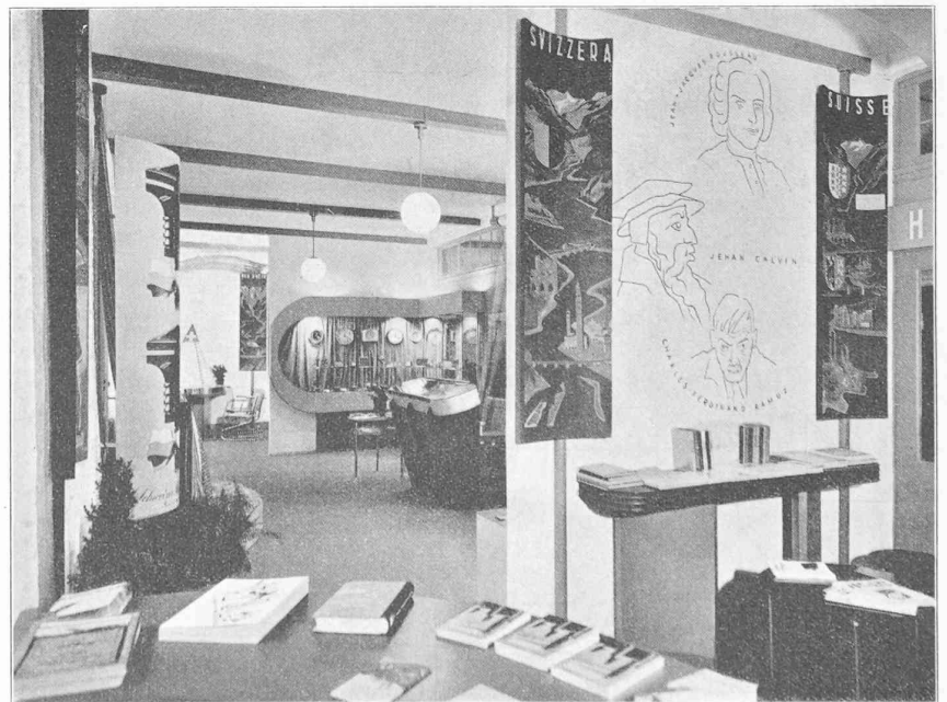
Vue générale de la Section suisse à la foire de Leipzig, 1941.

La section industrielle groupe trois activités dans un local constitué par les deux travées suivantes. On y parvient en traversant le tourisme, mais, par les baies vitrées du dégagement central, le visiteur qui ne serait pas entré dans le stand embrasse néanmoins d'un seul coup d'œil l'aménagement d'ensemble des produits exposés. La vitrine de l'horlogerie, où quatorze industriels de la montre exposent plus de septante pièces, occupe le premier angle. Une partie des pièces exposées