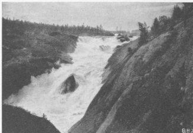
Fig. 7. — Chutes de Hårspranget.

Écoulement au pied du barrage. A remarquer l'agitation de l'eau dans le bassin amortisseur non revêtu.