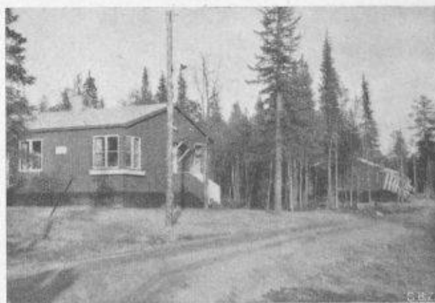
Fig. 10. — Cité ouvrière au nord du Carole polaire.