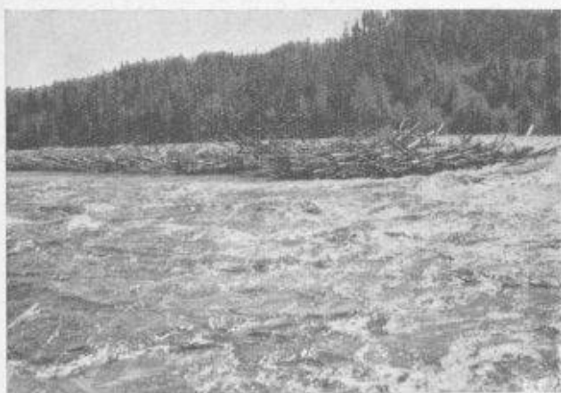
Fig. 9. — Nämforsen à l'aval du barrage. Curieux amoncellement de bois de flottaison.

Il n'y a rien de spécial à relever sur les installations de préparation de matériaux et de fabrication du béton. La