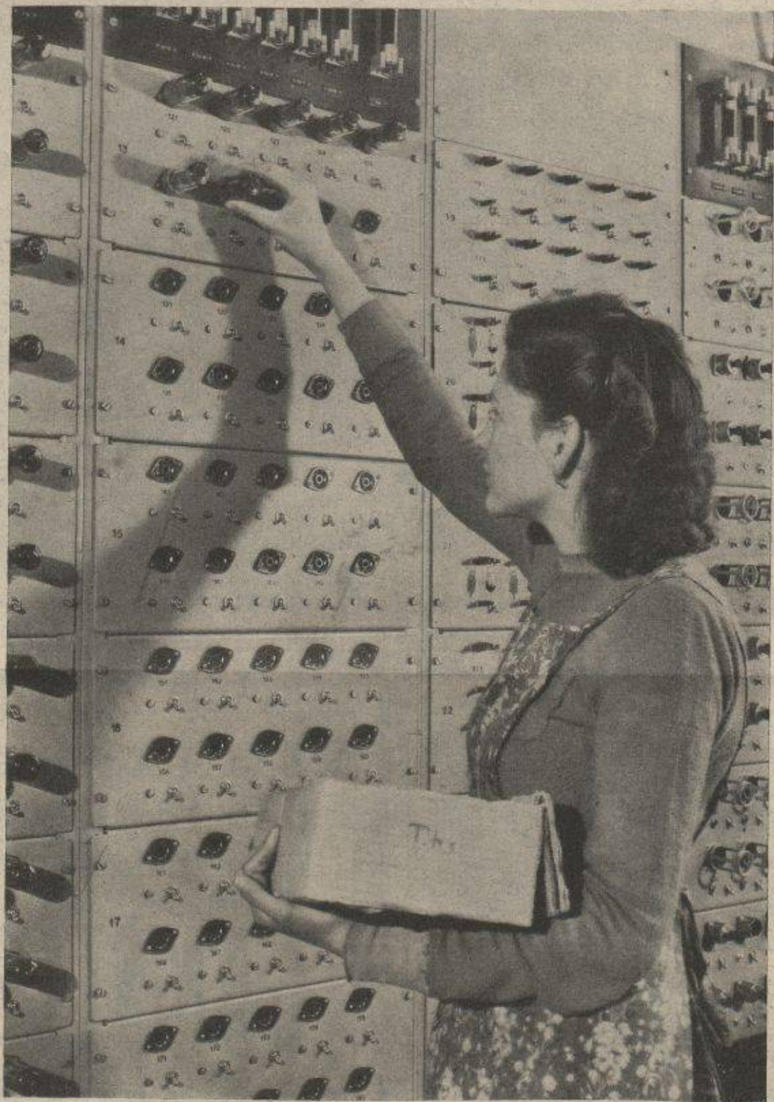
Essai de lampes de radio dans notre laboratoire