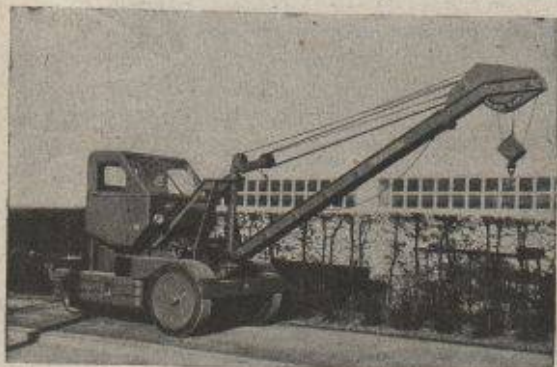
GRUES MOBILES KRANE KAR U.S.A.

Meynadier & Cie S.A. Berne, 24, Seidenweg, tél. 3 75 39