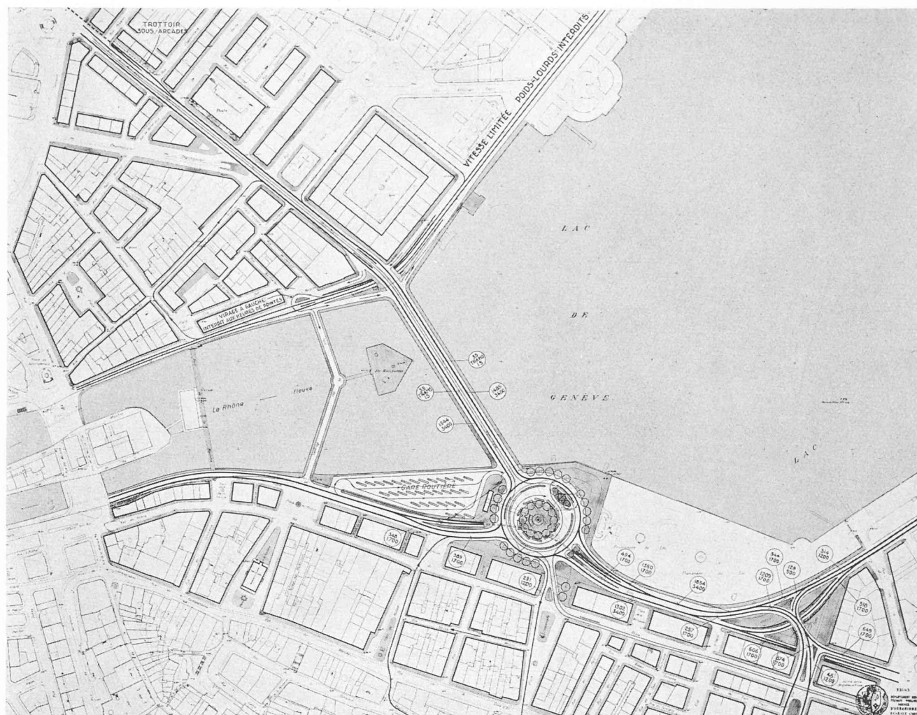
Plan de situation. — Echelle 1 : 6000.

2 e prix : projet « Clothoïdes », M. J.-J. Dériaz, architecte, Genève.