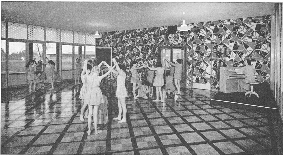
Salle de rythmique.