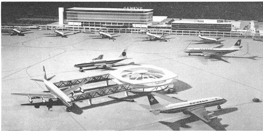
La nouvelle aérogare de Genève-Cointrin. Vue du côté piste. A l'avant-plan : un satellite.

pays, sur l'urbanisme et les liaisons qui permettront aux passagers d'atteindre rapidement la voie des airs. Tout peut être résumé simplement : l'autoroute de Suisse traverse (en sous-sol) la place de l'aérogare et est reliée à celle-ci par des bretelles ad hoc, une gare de chemin de fer à rebroussement est prévue afin d'avoir la liaison ferroviaire avec les principales villes de l'ouest de la Suisse et de la Savoie, l'accès à Genève étant pratiquement le même que celui que nous avons maintenant, le centre de la ville se trouvant à cinq kilomètres de l'aérogare. Un parking important est prévu autour des bâtiments, parking très « différencié », permettant de résoudre, pour l'instant, le problème chaque jour plus impératif du logement des véhicules à moteurs. Une