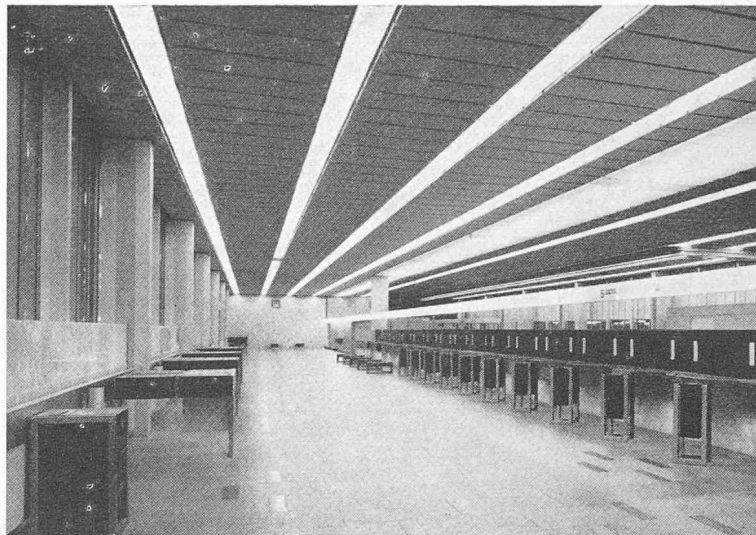
Ci-dessus : le hall des guichets.