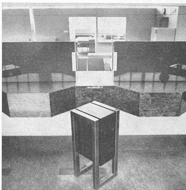
Vue d'un guichet.

Les premières expériences faites ont pleinement confirmé les espoirs mis dans cette réalisation qui s'inscrit dans la planification générale des services postaux suisses.