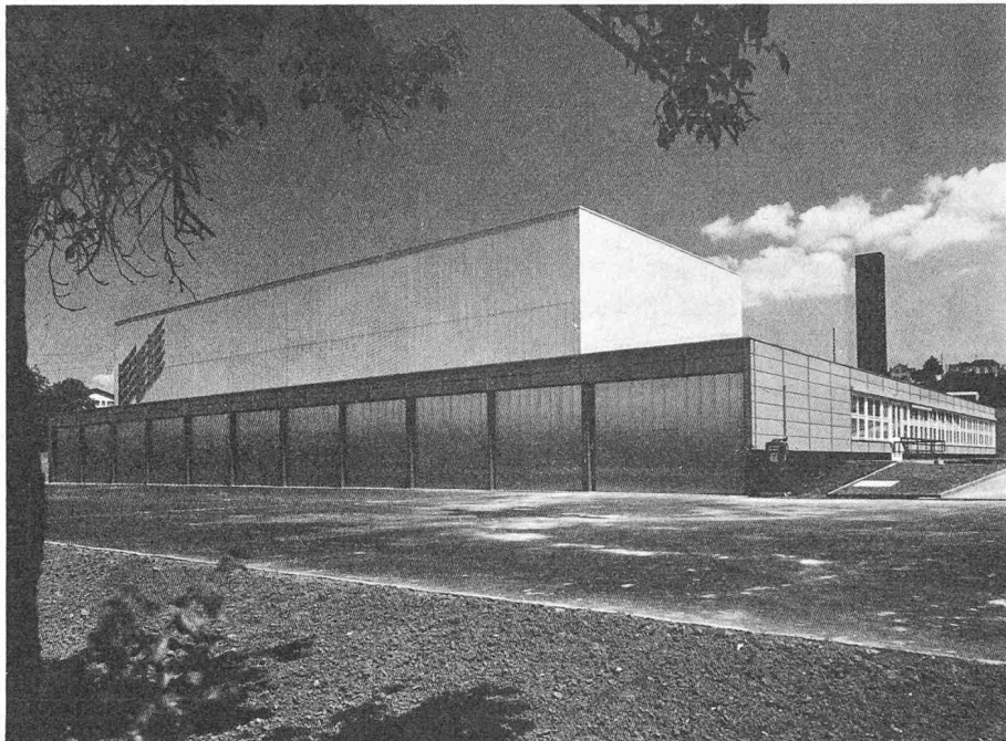
Fig. 1. — Vue générale.

Il faut éviter aussi que la machine ne dépasse les gabarits d'exploitation (par exemple, le dernier casier). Pour cela, un dispositif spécial doit permettre la surveillance ininterrompue de toutes les informations et de tous les circuits. Dès la constatation d'une erreur, on doit éviter que le gerbeur ne heurte les butoirs. Si, par exemple, l'interrupteur principal du moteur d'entraînement ne fonctionne plus, le courant n'est pas coupé au signal de freinage. Il faut donc un dispositif de sécurité qui empêchera la machine d'atteindre la butée d'arrêt à la vitesse de 2,5 m/s pour un poids de 10 t. On évite ce danger en disposant des sécurités supplémentaires aux extrémités des couloirs pour déclencher le freinage d'urgence.